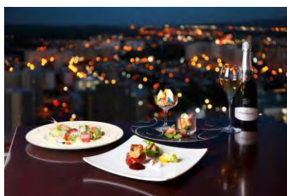
ホテルエミシア札幌