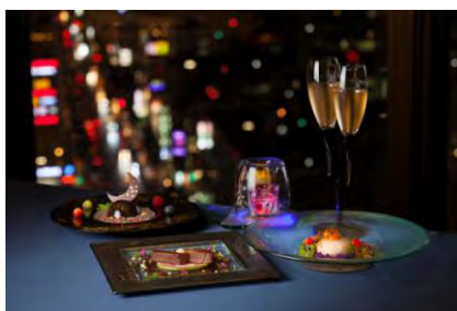
センチュリーロイヤルホテル