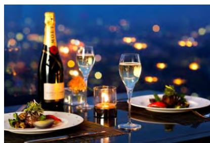
JRタワーホテル日航札幌

展望レストランのある札幌市内の3つのホテル（センチュリーロイヤルホテル、ホテルエミシア札幌、JRタワーホテル日航札幌）が、10月1日（土）を「札幌ホテル夜景の日」と定め、同日より夜景をテーマにした特別ペアディナーをご提供いたします（11月30日まで）。