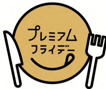
官・民連携の消費国民運動プレミアムフライデーのロゴマーク

プレミアムフライデーで美味しい週末を！ 「金」にちなんだ華やかな料理を和食、洋食で